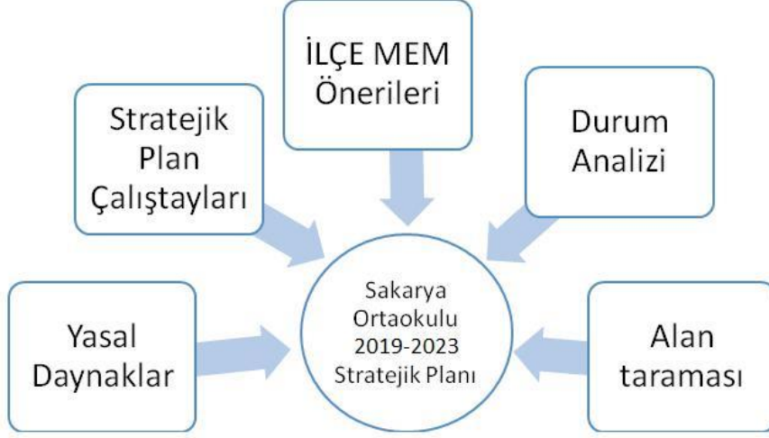
Şekil 1: Stratejik Plan Hazırlık Çalışmaları

Stratejik Planlamaya İlişkin Usul ve Esaslar Hakkında Yönetmelik gereği hazırlanan 2023/26 Sayılı Genelge ile 2019-2023 stratejik plan çalışmaları başlatılmıştır. Genelge ekinde yer alan hazırlık programında yapılması gerekenler, kurulacak ekip ve kurullar ile sürece ilişkin iş takvimi belirlenmiştir.